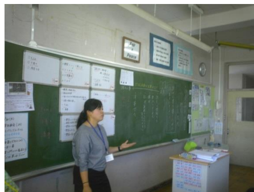
(学習計画を考えている授業)