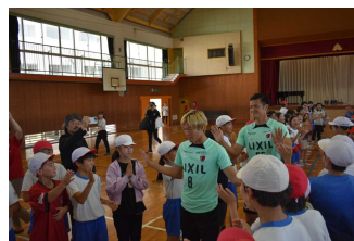
アントラーズ訪問

6月19日に、鹿島アントラーズ選手による小学校訪問がありました。質問したり、ドッジボールをしたり、歓声と驚きの時間を過ごすことができました。選手が学校を去るときには、児童から大きなコールが起こりました。地元アントラーズの活躍に期待が高まります。