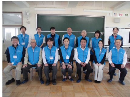
第1回学校運営協議会

「地域づくりは人づくり」というように、「なりたい自分になるために」邁進する子供たちのためにご協力いただいている方々に感謝申し上げます。地域に開かれた学校として、今後も連携・ご協力をお願いいたします。