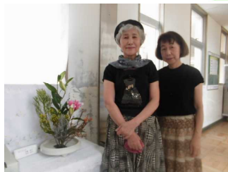
生花ボランティアの方々

昇降口を入ると、季節の花が出迎えてくれます。心やわらぐきれいな花は、地域の方々がボランティアで活かしてくださっているものです。本校は、地域のたくさんの方々を支えられています。